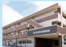
はなまる香里園 (介護付)