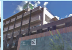
頂～いただき～ (介護付)

当社は介護事業も運営しているため 不動産の売却だけでなく、将来の暮らし まで見据えた住み替えのご提案いたします