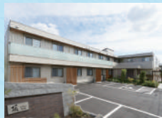
頂くずは別邸 (住宅型)