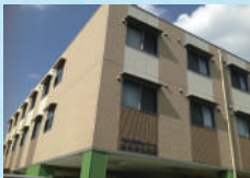
はなまる招提 (介護付)