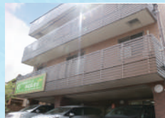
はなまる星田 (住宅型)