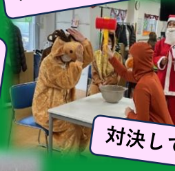
対決してトナカイの勝利！