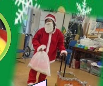
トナカイがおらのじゃ面接しよ〜