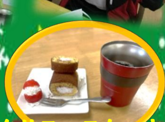
クリスマスケーキ