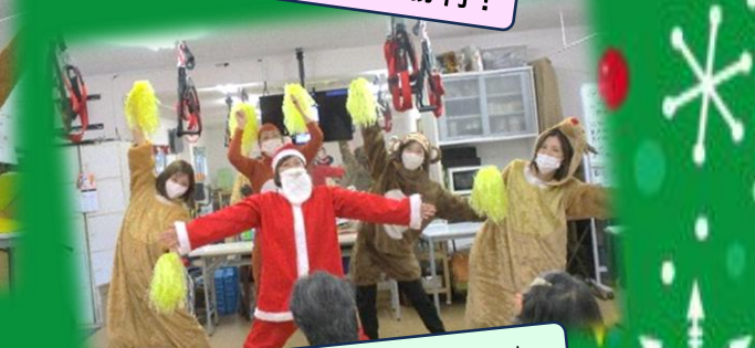
ダンス「ヤングマン」