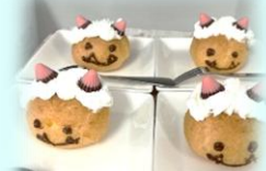
鬼シュークリーム