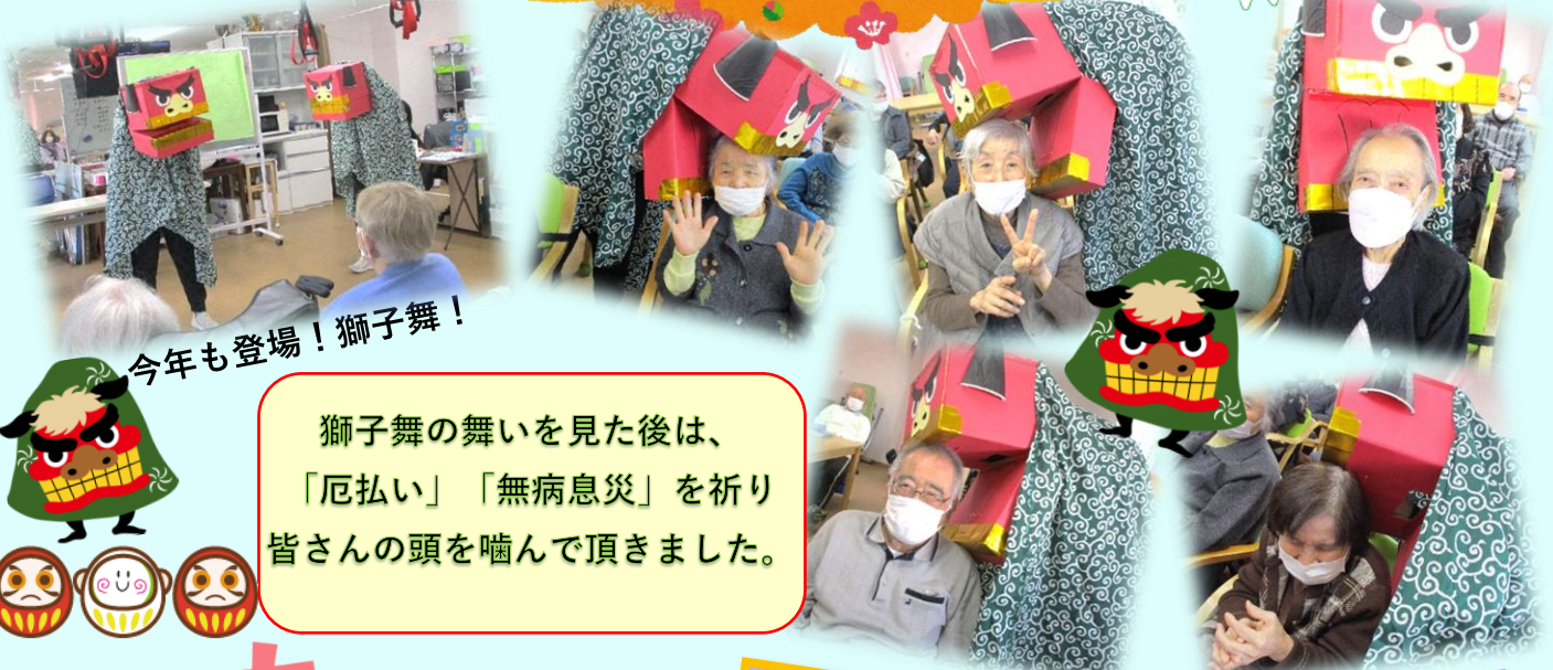
今年も登場！獅子舞！