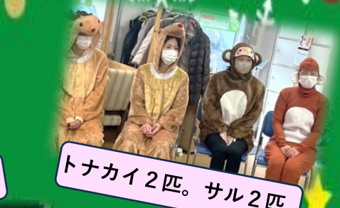
トナカイ2匹。サル2匹