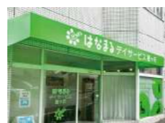
はなまるデイサービス 星ヶ丘