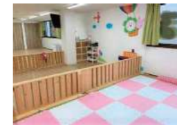
はなまる保育園 枚方公園