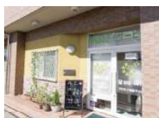
はなまるデイサービス 交北