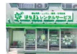
はなまるレンタルサービス (宇治支店)