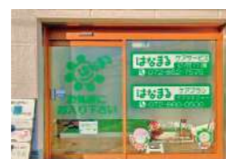
はなまるケアサービス 東香里