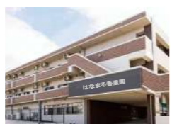
はなまる香里園 (介護付)