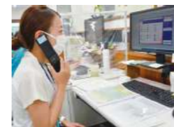
はなまるケアプラン 東香里