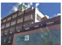
頂~いただき~ (介護付)