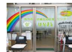
(第一圏域くずは) 枚方市地域包括支援センターはなまる