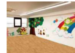
はなまる保育園 山之上