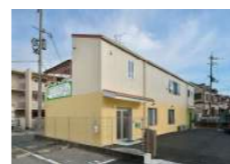
はなまるレンタルサービス (本社/枚方)

福祉用具(車イス・ベッド等)のレンタルや販売、住宅改修等 自宅快適に過ごす為に必要なサポートをいたします (株式会社TIME)