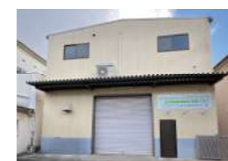
はなまるレンタルサービス (寝屋川支店)