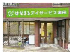
はなまるデイサービス 津田