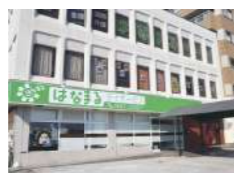
はなまるデイサービス 山之上