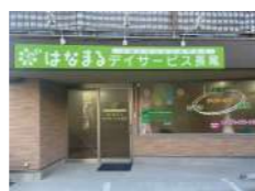
はなまるデイサービス 長尾