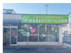
はなまるデイサービス 枚野