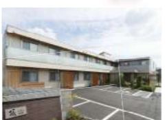
頂くずは別邸 (住宅型)