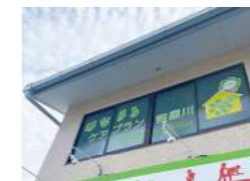
はなまるケアプラン 寝屋川