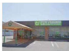
はなまるデイサービス 東香里