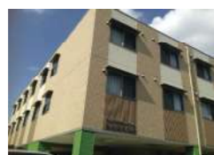
はなまる招提 (介護付)