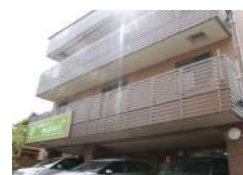
はなまる星田 (住宅型)