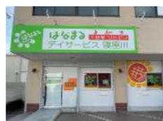
はなまるデイサービス 寝屋川