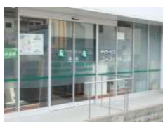
ユーフィット高殿