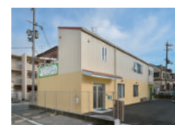
はなまるレンタルサービス (本社/枚方)

福祉用具(車イス・ベッド等)のレンタルや販売、住宅改修等 自宅で快適に過ごす為に必要なサポートをいたします (株式会社TIME)