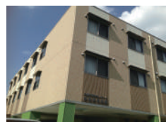
はなまる招提 (介護付)