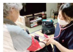
はなまるケアサービス 東香里