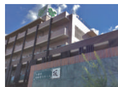
頂～いただき～ (介護付)