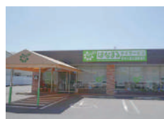
はなまるデイサービス 東香里