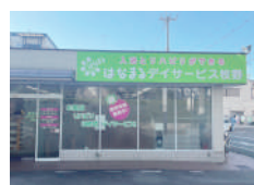
はなまるデイサービス 枚野