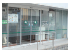
ユーフィット高殿