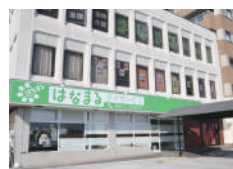
はなまるデイサービス 山之上