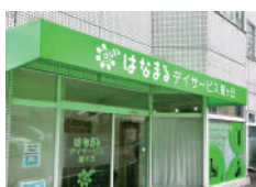
はなまるデイサービス 星ヶ丘