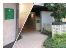
アイフィット淀川