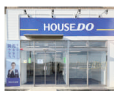
(株式会社スイッチ)