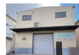
はなまるレンタルサービス (寝屋川支店)