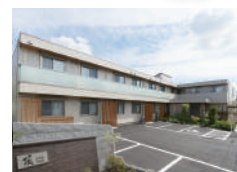
頂くずは別邸 (住宅型)