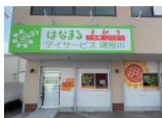
はなまるデイサービス 寝屋川