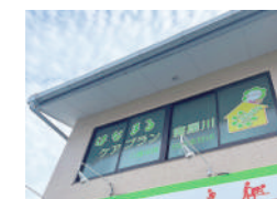
はなまるケアプラン 寝屋川