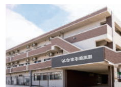
はなまる香里園 (介護付)