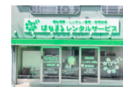
はなまるレンタルサービス (宇治支店)