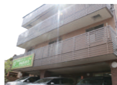
はなまる星田 (住宅型)