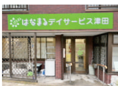
はなまるデイサービス 津田