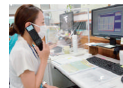
はなまるケアプラン 東香里