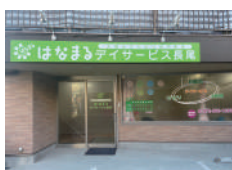
はなまるデイサービス 長尾