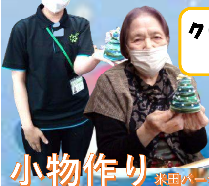
クリスマスツリー 作り