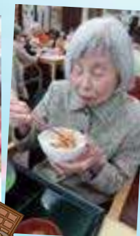
おやつには チョコレートフォンデュ