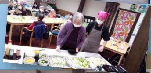
サラダバイキング

もう年末が来ました!! 早いですね~ 今年も1年あったという間でしたね 年末年始について 12月は29日まで、1月は4日から営業いたします