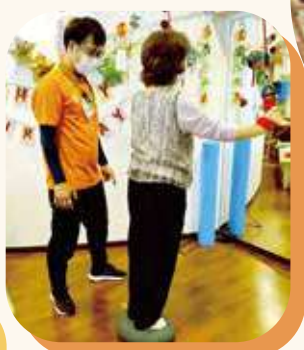
おすすめ 機能訓練&各種マシン

レッドコードはパーキンソン病 脳疾患、腕が上がりにくい、 麻痺がある方等にお勧め!