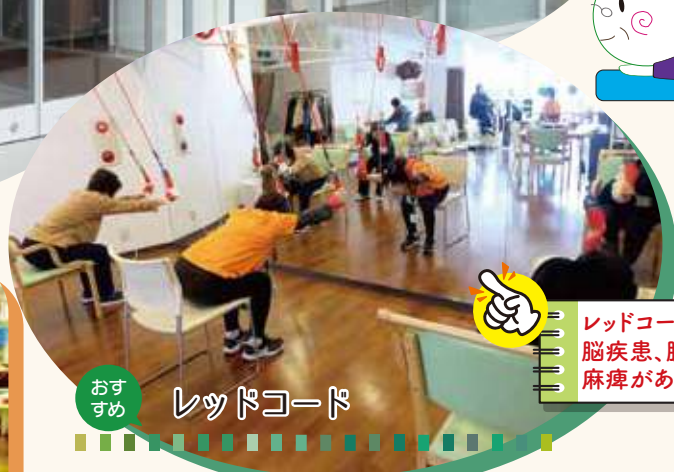
おすすめ レッドコード