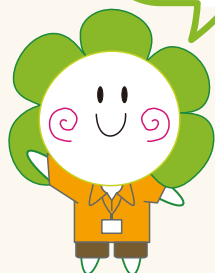
楽しい レクリエーション&おやつ