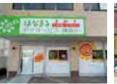
はなまるデイサービス 寝屋川