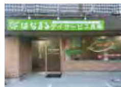
はなまるデイサービス 長尾