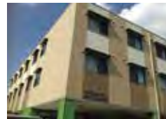
はなまる招提 (介護付)