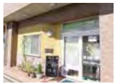
はなまるデイサービス 交北