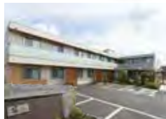
頂くずは別邸 (住宅型)