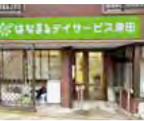
はなまるデイサービス 津田