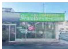
はなまるデイサービス 牧野