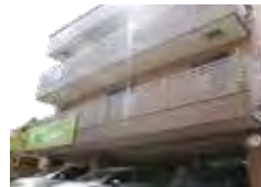
はなまる星田 (住宅型)