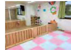
はなまる保育園 枚方公園