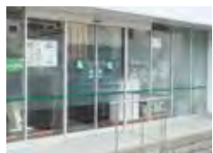
ユーフィット高殿