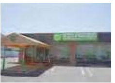
はなまるデイサービス 東香里