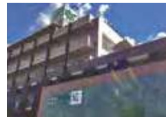
頂~いただき~ (介護付)