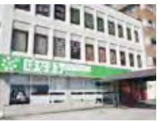
はなまるデイサービス 山之上