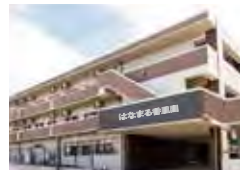
はなまる香里園 (介護付)