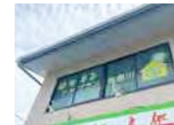
はなまるケアプラン 寝屋川