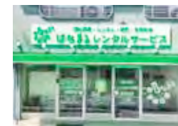
はなまるレンタルサービス (宇治支店)