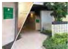
アイフィット淀川