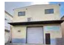
はなまるレンタルサービス (寝屋川支店)