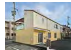
はなまるレンタルサービス (本社/枚方)

福祉用具(車イス・ベッド等)のレンタルや販売、住宅改修等 自宅で快適に過ごす為に必要なサポートをいたします (株式会社TIME)