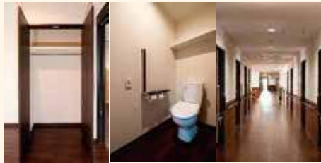
全室トイレ・クローゼット・洗面台付