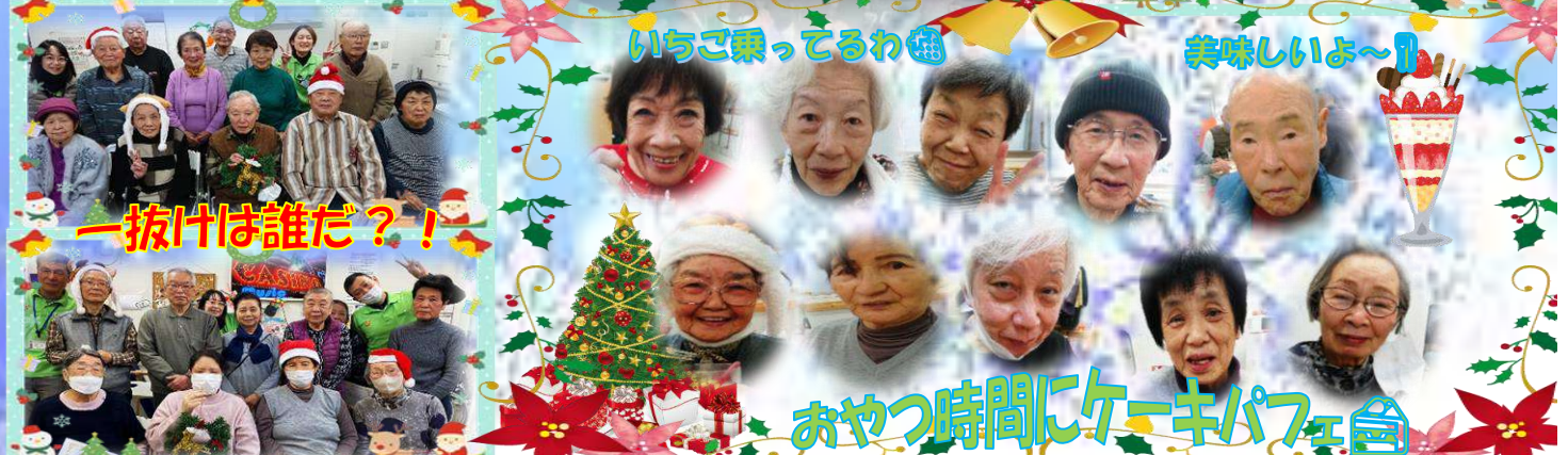
おやつ時間にケーキパフェ

ご家庭でお困りの事や、運動の事でご不明な点がございましたらスタッフへお気軽にご相談ください。