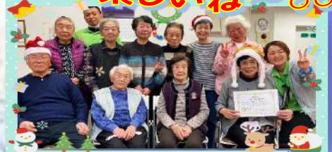
☆クリスマスパーティ☆