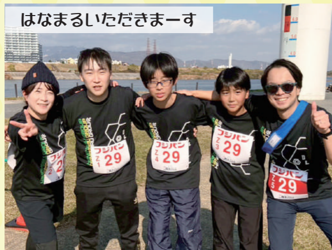
はなまるいただきまーす