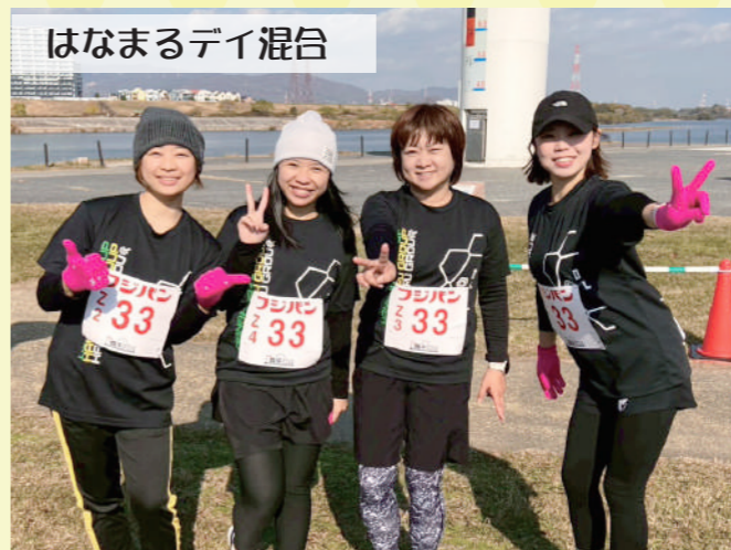
はなまるデイ混合