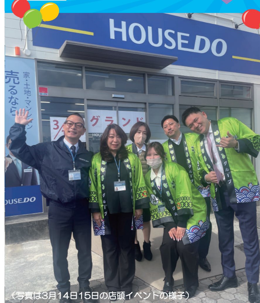
(写真は3月14日15日の店頭イベントの様子)