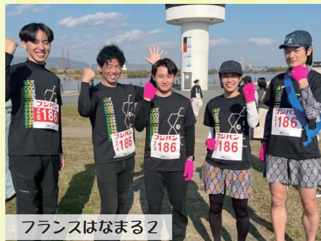
フランスはなまる2