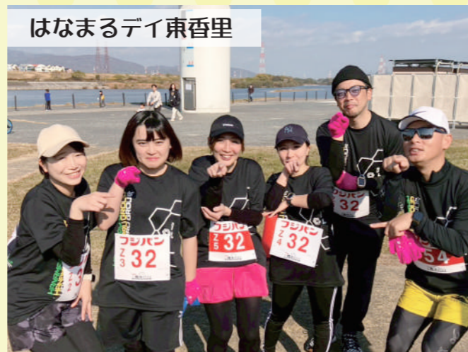
はなまるデイ東香里